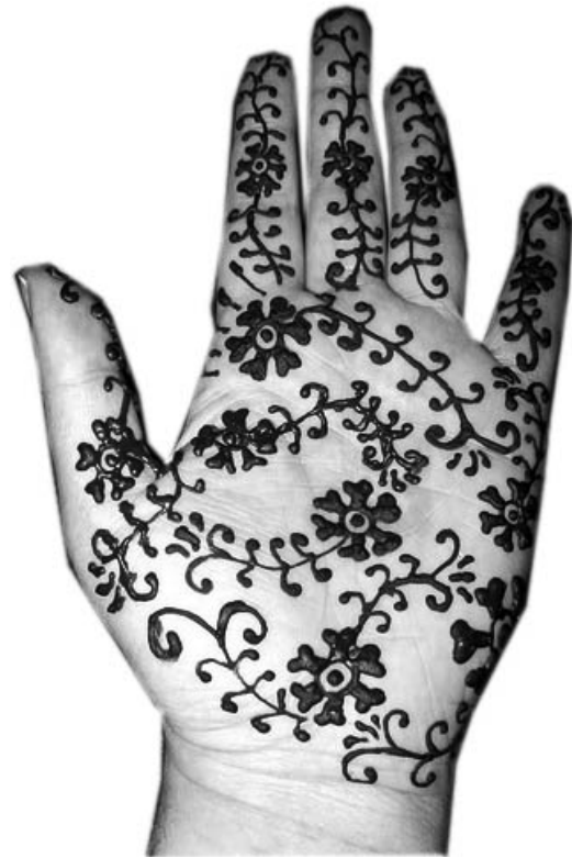
Sentir mon être garni de fleurs

Merci à toi Verger fleuri. Que viennent à toi d'autres amis, Que ta joie éclaire nos vies.