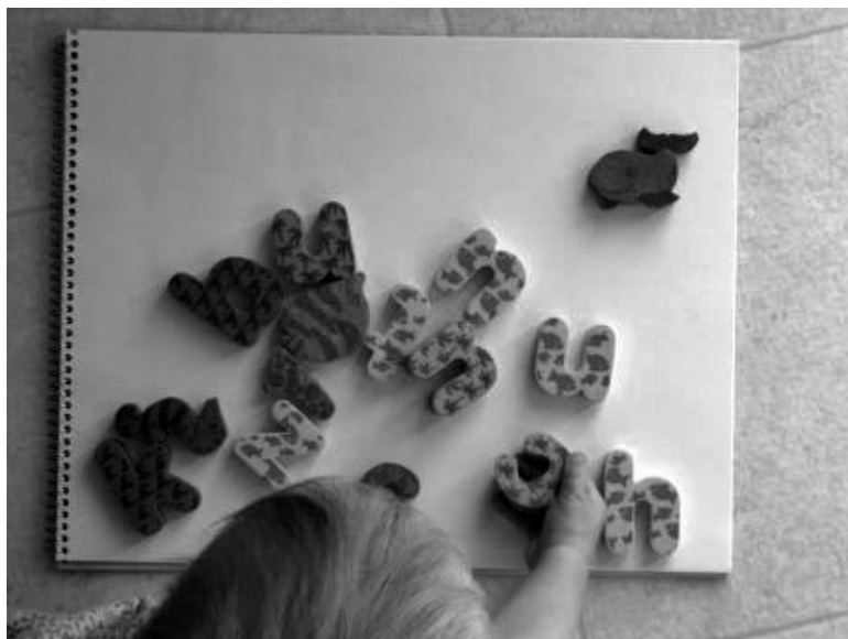
Fais danser mes mots

Suite à l'atelier d'écriture portant sur les affirmations positives. Voici trois textes choisis :