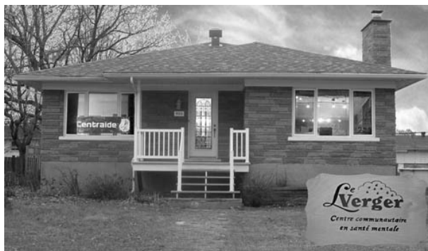
Le Verger vous remercie de tout cœur

Un grand Merci aux fondations, organismes et donateurs sans lesquels nous ne pourrions poursuivre notre mission :