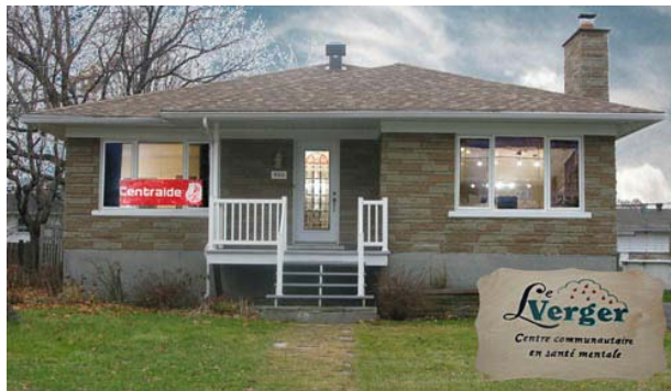
Le Verger vous remercie de tout cœur

Un grand Merci aux fondations, organismes et donateurs sans lesquels nous ne pourrions poursuivre notre mission :