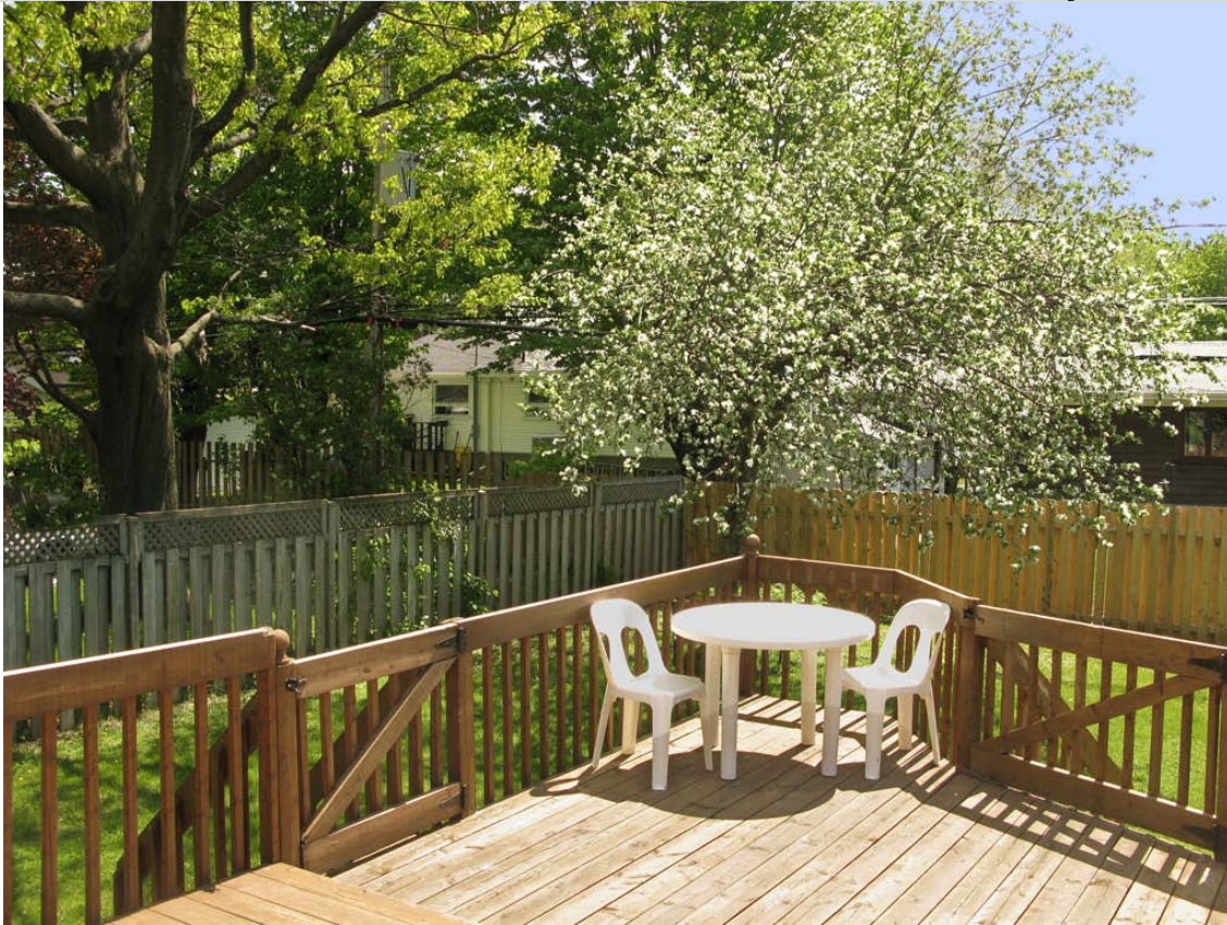
La terrasse du Verger avec son pommier fleuri